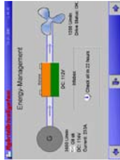
Communication C3 Cockpit Données système centralisées 1)

1) Le tableau présenté diffère selon le bateau ou l'équipement concerné