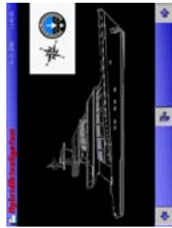
Commande C3 Cockpit Instrumentation centralisée 1)