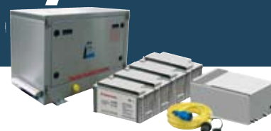
Système intégré de propulsion hybride et d'énergie de bord