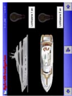
Contrôle C3 Cockpit Informations centralisées 1)