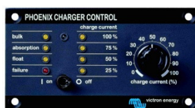
Tableau 'Phoenix Charger Control'

Alarme visuelle et sonore en cas de tension batterie trop haute ou trop basse. Seuils de déclenchement réglables. Contact sec pour signalisation déportée.