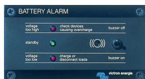
Tableau 'Battery Alarm'

Alarme visuelle et sonore en cas de tension batterie trop haute ou trop basse. Seuils de déclenchement réglables. Contact sec pour signalisation déportée.