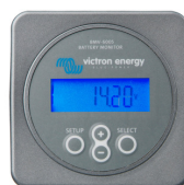
Contrôleur de batterie BMV-600S

Commande à distance et signalisation complète du chargeur. Permet également de régler le courant de sortie et ainsi de limiter la puissance AC demandée en entrée. Cette fonction est particulièrement utile lorsque le chargeur est raccordé sur une borne de quai ou sur un groupe électrogène de faible puissance. Sert également à paramétrer le chargeur. L'intensité des voyants s'ajuste automatiquement en fonction de la lumière ambiante. Raccordement au chargeur par un cordon standard UTP.