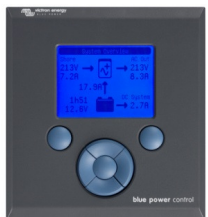
Tableau de commande Blue Power

Une solution pratique et bon marché pour une surveillance à distance, avec un bouton rotatif pour configurer les niveaux de Power Control et Power Assist.